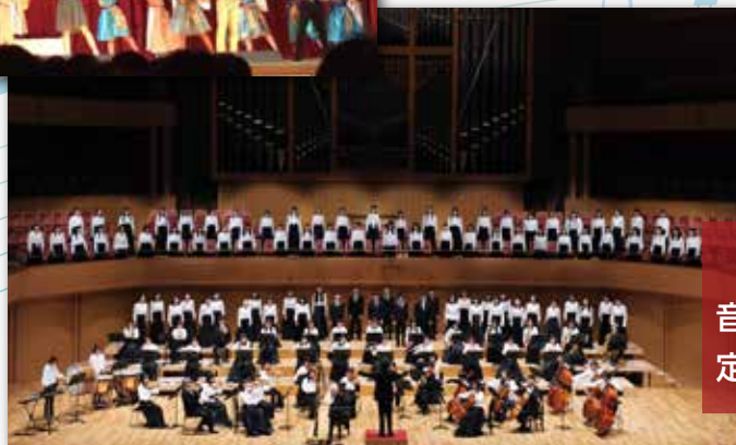
音楽科 定期演奏会