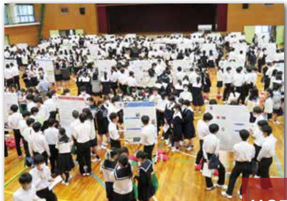
MCデー (SSH研究 発表会)